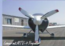
Luscombe mit MTV-9 Propeller