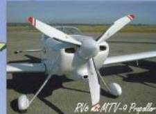
RV6 mit MTV-9 Propeller

e-mail: sales@mt-propeller.com www.mt-propeller.com