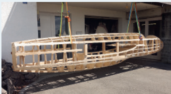
Rumpfhohbau des Nachbaus noch ohne Einbauten. | Gros-œuvre du fuselage de la coque de la réplique encore sans équipements.